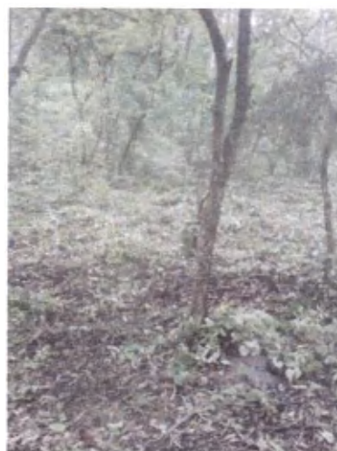
(foto 11 y 12) Área propuesta para establecimiento de estructuras de conservación de suelos.

La vigilancia desde la torre se realiza de 8:30 a 17:00, siendo los encargados los agentes de seguridad, previniendo cualquier infracción a la seguridad visible desde la torre así como ingreso de personas no permitidas.