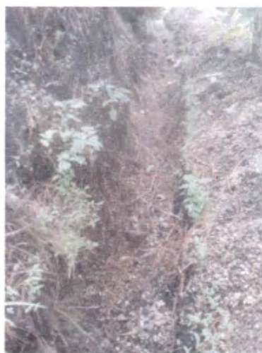
(foto 9 y 10) Estado actual de las estructuras de conservación de suelos. (Acequias)

El establecimiento se tiene programado para el mes de noviembre, cuando las condiciones de humedad sean óptimas para la perforación de la zanja y pueda quedar con las dimensiones necesarias.